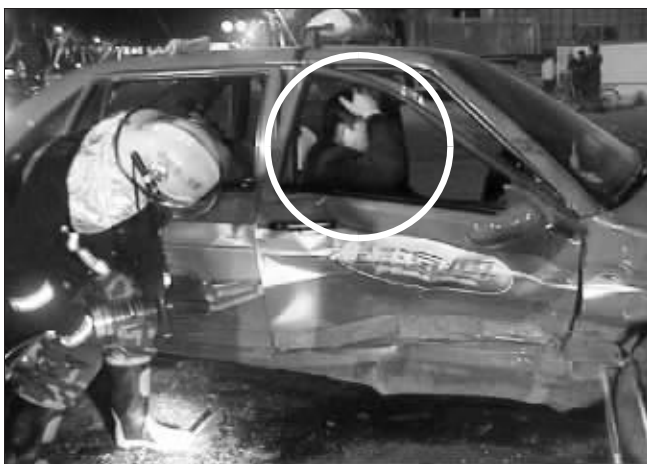
被撞出租车里的乘客被卡住了

有关系,要不然他不会这个样子!”“开着好车,难道就这么嚣张吗?”围观者议论纷纷,这名胖男子不但不理会众人,而且嘴里一直骂骂咧咧。