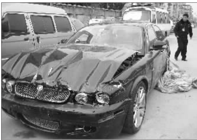
肇事车头上最帅的“飞豹立标”已不知去向