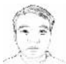
Pen News 潘文军 编译专栏