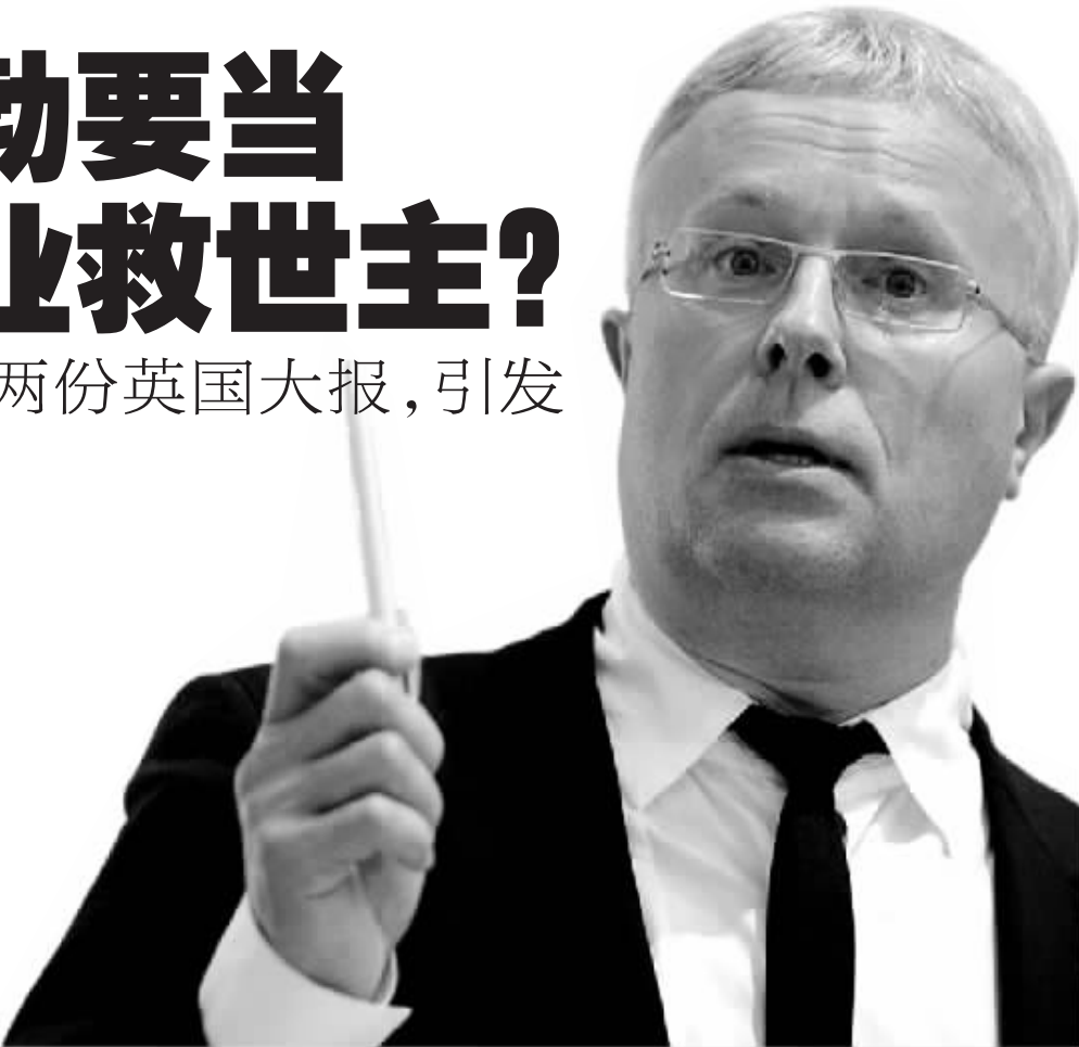
亚历山大·列别捷夫

他曾是克格勃派驻英国的特工,苏联解体后成为俄罗斯新贵,去年以1英镑买下《伦敦晚报》,短时间内令其扭亏为盈。最近,他紧锣密鼓再收购一份英国报纸——著名的《独立报》。俄罗斯亿万富翁亚历山大·列别捷夫,自诩为“英国报业的救世主”。但在众多对俄罗斯抱有警惕的阴谋论家看来,他是朋友还是敌人?他出手“抢救”病危的英国老报,又是否另有所图?