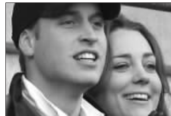
威廉与凯特很恩爱

据英国《每日电讯报》2月23日报道,最近坊间再次传出英国威廉王子即将大婚的新闻,与之前数次不靠谱的消息相比,这回威廉王子亲口表示,他想在凯特的手指上系个结(意为结婚)。