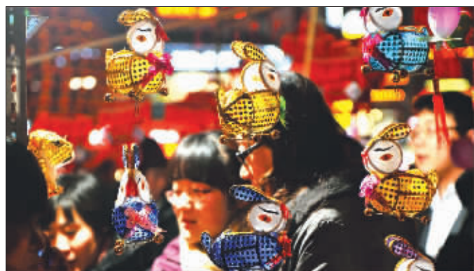
做工精致的小兔灯

究竟去看哪一个灯会?记者欣赏后,在此给读者细细介绍一下,看看它们各自都有哪些亮丽的看点及不同之处。