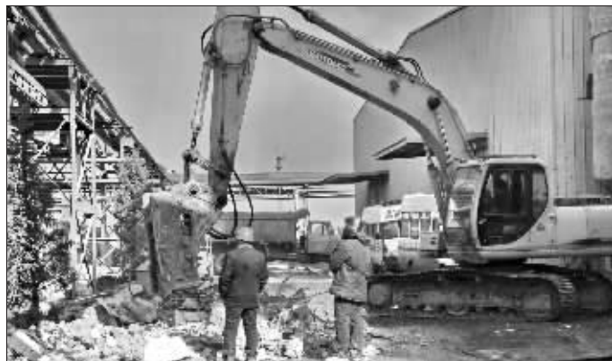
2月25日,工人在清理事故现场

安政逃出车间后看到,不断有工友从车间里面跑了出来,一些人跑出来时衣服上还带着火。随后,医护人员、消防和其他人员接连赶到了现场,自己被送到了医院。