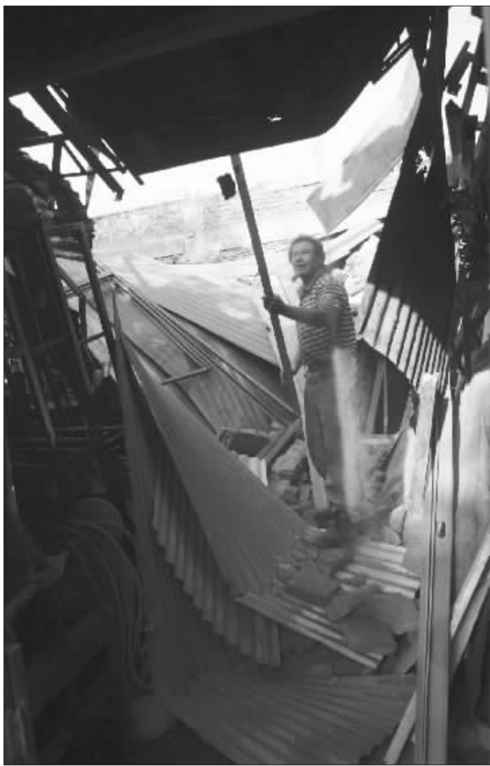
2月27日,在智利首都圣地亚哥,一名男子在地震发生后清理受损的房屋。