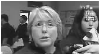
智利总统巴切莱特宣布国家进入“灾难状态”。

智利当地时间27日凌晨3时34分遭受里氏8.8级地震,这次地震中距离智利全国第二大城市康塞普西翁大约115公里,震源深度约为35公里。地震已造成至少122人死亡,现阶段尚无中国公民伤亡报告。地震还触发海啸,太平洋及沿岸诸多国家纷纷加强戒备。不过中国国家海洋环境预报中心27日下午发布消息称,预计此次智利地震引发的海啸对我国沿海无影响。