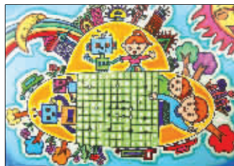
《一家人》 黄宗尧 长江路幼儿园大班 指导教师:姚静