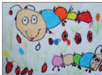
《可爱的小虫》 崔子苏 崇安中心幼儿园中二班