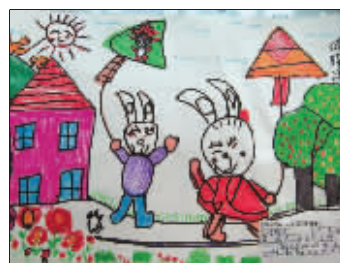
《春节放风筝》 付锦洋 5岁 凤凰幼儿园 指导老师:吴静