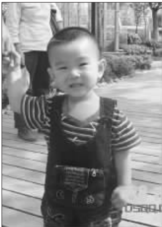
880号航天宇 生日: 2008年2月21日 活泼好动,最爱打球

半夜了,我说饿,不吃不行,金鼎轩吧,24小时营业。去了营业员问吃什么,拿着菜单从头翻到尾,就点一个汤,营业员问还要别的么?不要。就要一酸萝卜老鸭汤。问想吃啥子么,说想,刚进门就想吃,来个辣炒的,炒上来,一看那么多辣椒,一筷子没有动。看着就想吐。吃完出门,刚走不远,费半天劲喝进去的汤全给吐出来了。