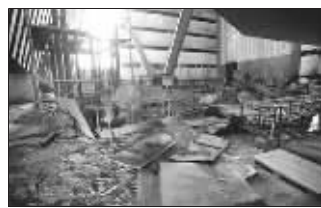
5层的大厅被部分烧毁

5层至26层为酒店客房,位于北侧的客房多数躲过大火肆虐,客房装修基本完整,其他方向的客房都不同程度过火,9层10层的部分客房被完全烧毁。 据《京华时报》