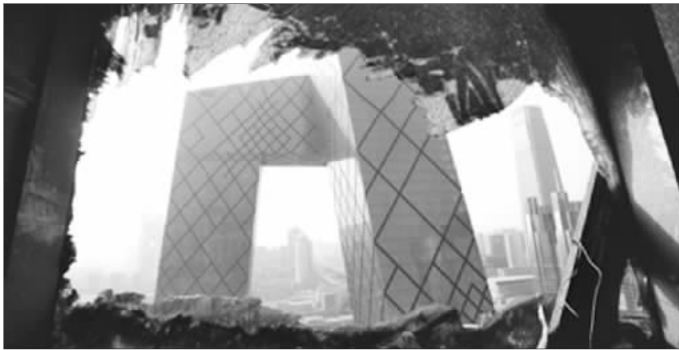
不远处就是央视主楼

央视大火案整个抓捕过程前前后后历时近4个月,其中最早一批被告人于去年2月9日火灾当晚就被警方控制,随着案件调查深入,警方不断扩大抓捕范围。此案审查起诉时共23人涉案,经检方审查,最终对其中21人提起公诉。21名被告人中,7人来自央视,6人来自施工单位,两人来自湖南省浏阳市三湘烟花公司。 据《北京晚报》