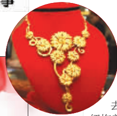
“一辈子的爱”18K金项链