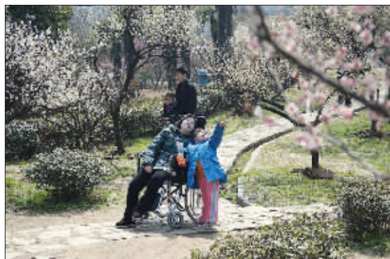
妈妈,你看 昨天下午,在古林公园,一个小女孩问妈妈,那个是什么花呀? (作者胡海将获 30 元话费)