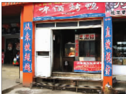
从未被超越 郁金香路的这家啤酒烤鸭店,请迈克尔·杰克逊做了代言人? (作者李正国将获 30 元话费)