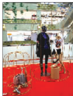
金丝雀 河西一家商场里,衣服和包包放在笼子里展示。(作者吴其仁将获 30 元话费)