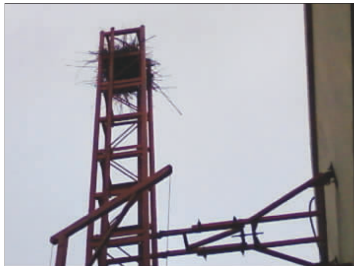
鸟窝做在升降机上,鸟宝宝们真是上上下下地享受啊。 (作者将获 30 元话费)