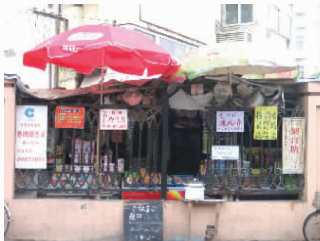
万能饮料店 一个卖饮料的小店铺,竟然卖起脚气灵、冻疮膏、粘鼠胶、梨膏糖、香烟、奶茶、甜玉米,还发布招聘保姆广告……真是“麻雀虽小五脏俱全”啊。 (作者傅先生将获 30 元话费)