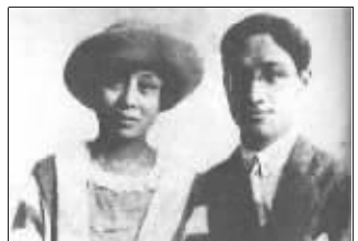
徐志摩和张幼仪的合影 资料图片