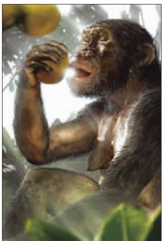
寻找食物和水的长征,让我们祖先的体毛脱落了 资料图片

及其同事在一项研究中,检测了人类肤色基因之一——MC1R基因的序列。他们的研究表明,非洲黑人几乎都有一个MC1R基因的特殊突变,出现于120万年前。一般认为,人类祖先的皮肤呈粉红色,上面覆盖着一层黑色毛发,就像今天的黑猩猩一样。据此可以推测,能为人类祖先抵挡太阳的体毛脱落后,黑色皮肤是必要的进化产物。因此,罗杰斯和同事的相关估算,为我们提供了裸露皮肤进化出现的最晚时间界限。