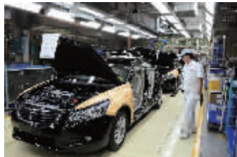
工人既是生产者也是质检员

和其他的汽车厂商不同的是,广汽本田没有专门的质检部门。那为何他们所生产的汽车质量如此过硬呢?原来,在广本质量管理的职能无处不在,这是每位员工都需要肩负的责任。广本的质量控制已经完全融入了精益生产的过程。广本生产线上的每位员工正式上岗前都要接受生产工艺和质量标准的系列培训,在生产过程中坚持“谁制造、谁负责”的原则,以及“不接收、不制造、不放过不良品”的“三不”原则,要求员工随时发现产品生产过程中存在的任何质量问题,即使是零部件在运输途中受到轻微的划伤或碰伤,也会在接收零部件或装配时被排除出来。这样一