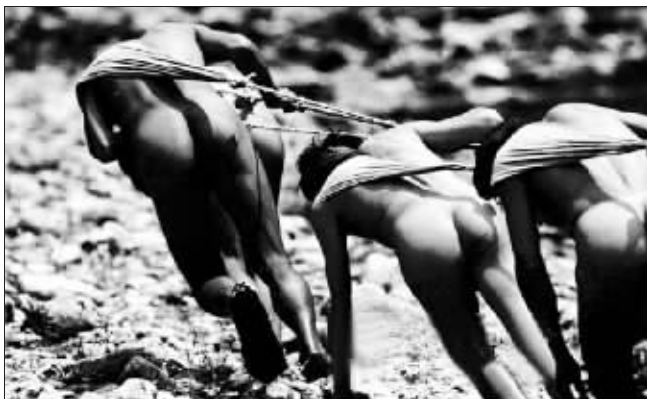
裸体纤夫已成为历史 资料图片