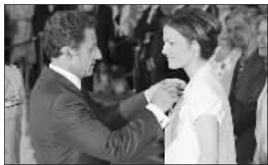
萨科齐和他的美女下属茹阿诺