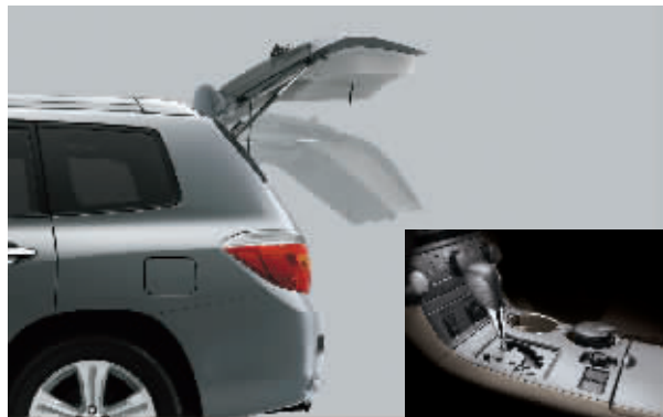
一键式智能开关行李尾门和2.7L 6速变速箱

在广汽丰田公布的2010年产销计划中,汉兰达今年的产销目标确定为7.5万台,成为广汽丰田最重要的增长动力之一。广汽丰田总经理葛原敏在接受采访时表示,随着产能提升准备工作的完成,汉兰达2010年的月产量将稳定在6000台以上,订单消化能力大为增强,车主可望早日实现“无界限”汽车梦想。截至2月份,汉兰达累计销量已逼近5万辆,订单量直逼6万辆。 沈宁