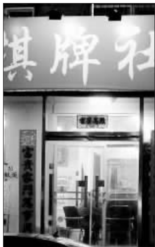
麻将社被指问题不少