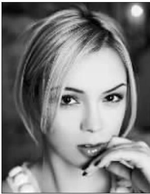
新娘的姐姐也是位美女

参加婚礼的只有戈尔巴乔夫家最亲近的朋友,在大约50名客人中,没有名人出席。在典礼就要结束时,才见到时尚设计师伊格·相普林到来,称得上是“秘密婚礼”。一对新人都不希望被曝光。最重要的客人当然是米哈伊尔·戈尔巴乔夫本人,他拿着超大束的红白玫瑰,在女儿伊琳娜和长外孙女克谢尼娅等人的陪同下准时出现,并第一个致辞。宴会厅工作人员说,整个婚礼花费100万卢布(约合人民币23万元),包括会场租金和餐费。