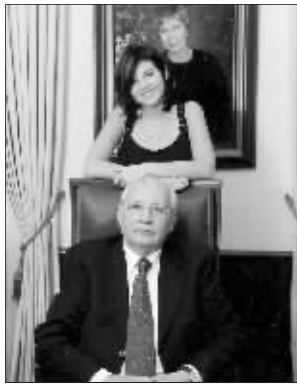
戈尔巴乔夫和阿纳斯塔西娅