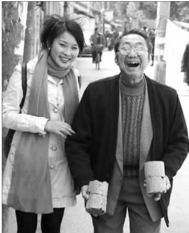
老爷爷问莫莫为什么要征集微笑,然后配合地给出了一个“大大的微笑”。