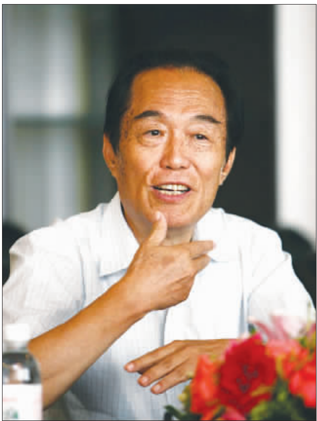
阎崇年被指“不尊重历史”，近年来饱受争议（资料图片）