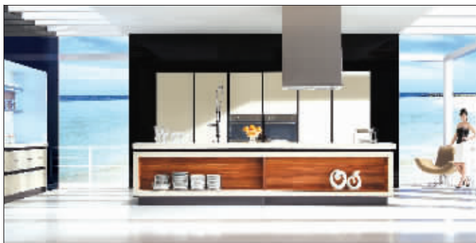
价值10万元的金牌橱柜将在本次主材展上惊艳登场

长江路九号、玛斯兰德、绿城玫瑰园……南京豪宅的业主们用的都是什么主材?答案是:卫浴用科勒、汉斯格雅,橱柜用东方邦太、金牌。还有4天,首届南京家装主材博览会(简称“主材展”)将在南京国际博览中心开幕。届时,科勒、汉斯格雅、TOTO、贝朗等“重量级”国际品牌将悉数亮相。想和豪宅主人们用同一品牌的家居产品吗?此次参展的众商家将拿出很大的优惠力度,让更多的消费者能拥有国际一线品牌产品。