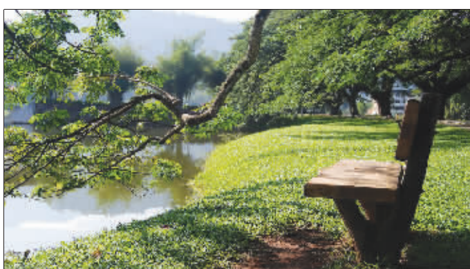
雕琢的绿色翡翠。我们与这美丽山水的邂逅就这样准备开始吧。

黄山以“三奇四绝”的奇异风采采冠于世,是我国唯一拥有三项世界级桂冠的风景名胜区。而黄山太平湖就像栩栩如生的巨龙横卧于群峰之间,犹如镶嵌在黄山与九华山之间的璀璨明珠,被誉为“黄山情侣”、“江南翡翠”、“水中黄山”、“天然氧吧”、“东方日内瓦”、“地球上最纯净的绿色家园”。