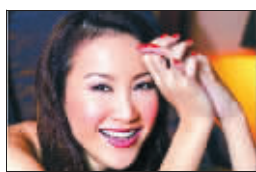
“上扬眉”VS 方形脸 显得妩媚娇俏

上扬眉:适合方形脸。上扬眉属于强调弧度的高挑眉形,能掩饰方形脸稍嫌硬朗的线条,使脸形圆润一些。