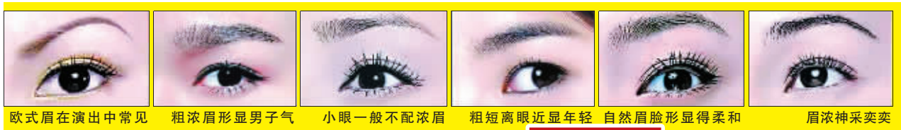
欧式眉在演出中常见 粗浓眉形显男子气 小眼一般不配浓眉 粗短离眼近显年轻 自然眉脸形显得柔和 眉浓神采奕奕