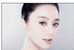
“自然眉”VS 倒三角脸 柔和脸部线条

自然眉:下巴尖尖的倒三角脸形可以选择的眉形相对较多。略带弯度的自然眉形,可以缓和脸部的线条,使脸形显得柔和。