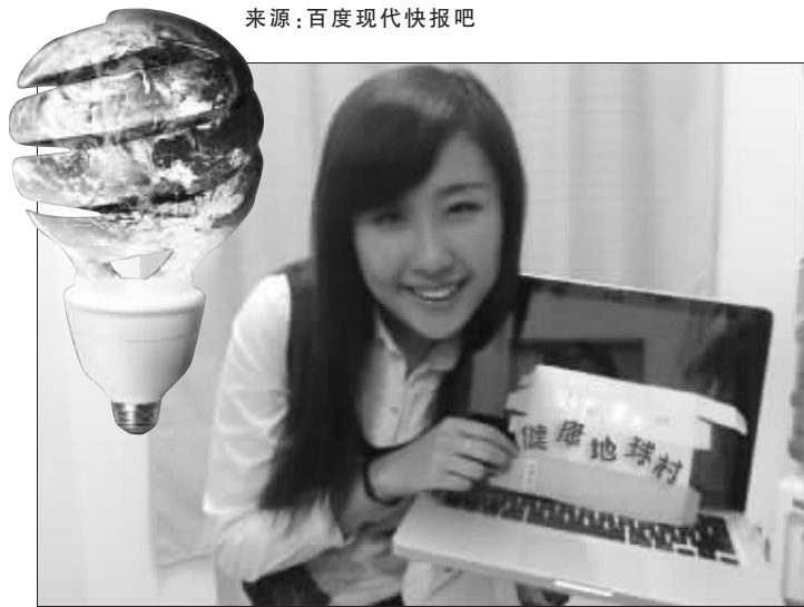
网友秀出已经关机的电脑

这几年,“低碳”的概念越炒越热,3月27日20:30~21:30的“地球一小时”也得到全球网友的支持。上周六晚上,全球6000多个城市的大楼纷纷脱下了华丽的外衣,熄灯一小时。而对于网友而言,“关机一小时”可能更体现自己对于“低碳”的贡献,连网咱都不上了,多低碳。百度“南京”吧的网友们上传了自己参与“关机一小时,低碳一小时”的照片,不过,也有人评论此举动就是“瞎搞”。