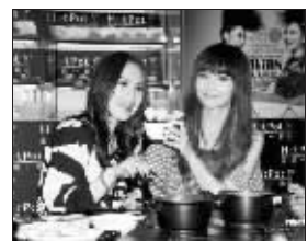
姐妹俩近日高调现身

格内向胆怯。因为面容较好,阿娇早早地做了兼职模特,开始在一些杂志上拍摄平面照片。阿娇曾表示,由于小时候没有爸爸,家里靠妈妈支撑,所以长大了就希望家里生活得好一些,入行是为了生活安定。不过阿娇也曾叛逆过,中学时期被送到澳洲念书的阿娇,有一年放假,偷偷跑回香港没告诉妈妈,害妈妈担心得要命,事后阿娇也觉得很难过。 韩垒