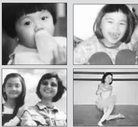
猜猜看,这组图片中哪个是阿娇,哪个是阿Sa?