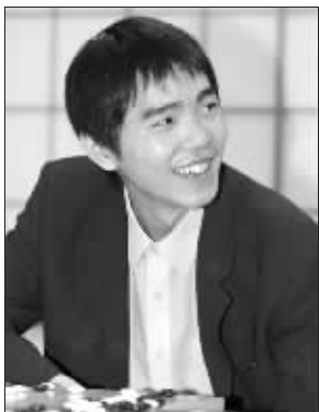
李世石越来越成熟