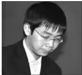
古灵益首次闯入世界大赛八强

李昌镐最近势头很猛,在不久前的第11届农心杯三国围棋擂台赛上,韩国队只剩他一个“光杆司令”,却连续三天三战三胜,以一人之力连胜刘星、古力、常昊,第9次为韩国队夺得冠军。