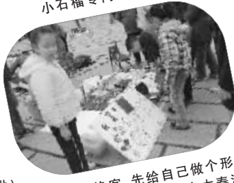
当好换客,先给自己做个形象广告