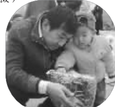
我跟爸爸围观鉴定这套拼装玩具