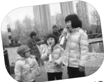
两个姐姐在表演,小妹妹时艺邺以最认真的倾听来捧场