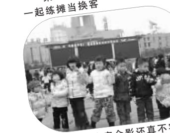
点点换客合影还真不容易