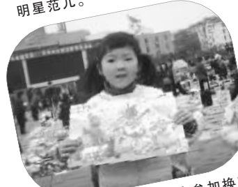
小石榴专门从盐城赶来参加换客节