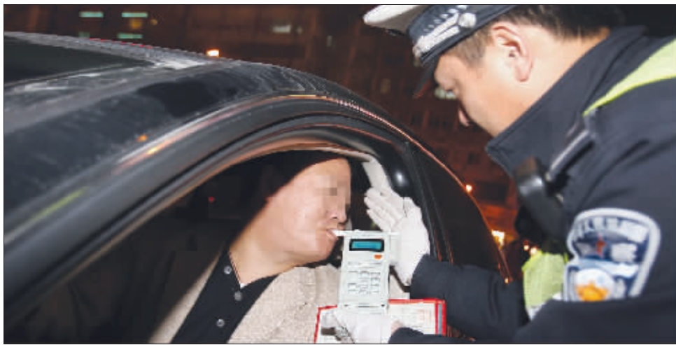
南京交警正在严查酒驾

严查酒驾的行动在江苏全省进行。南京第一个被处罚的会是谁呢?昨天傍晚6点,这个人在南京龙蟠中路被查获。而让他郁闷的是,他是中午喝的酒,以为过了这么长时间不会有问题,结果还是被查到了。