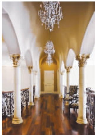
哈克系列:欧洲最名贵地板、零甲醛地板

Moland 地板源自丹麦,在二十世纪五六十年代,普遍流行于欧洲皇室,是丹麦最大的一家实木地板设计及销售公司。2007年对中国市场情有独钟的摩兰董事长克里斯蒂安·奥斯特卡德在中国注册了“摩兰”品牌,将丹麦特有的简约时尚文化气息引入中国。