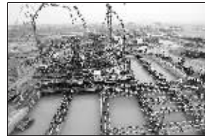
四桥正在施工

记者昨天从南京四桥技术专家组第二次会议上获悉,原计划2013年建成的南京长江四桥,将提前至2012年建成通车。据介绍,该桥建成后,“牵手”绕越与三桥,南京“大外环”江南段将提前闭合,同时长江以南的沪宁高速、宁杭高速、312国道也可通过它与宁淮高速、宁连高速、宁通高速等实现联网,经南京过江车辆将无须进入南京城,一路高速直达江北。