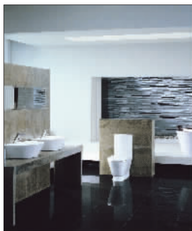
和成卫浴“中国风”越刮越猛

1931年,一个叫邱和成的年轻人在台湾用 12.5 美元创办了一个手工小作坊性质的制陶厂。经过 79 个春秋,当年的手工作坊已经发展成为世界知名的卫浴品牌,它就是和成卫浴(HCG)。如今,在北京人民大会堂、首都机场、上海东方明珠电视塔、浦东国际机场等很多地方都使用了和成的产品。和成卫浴之所以能够取得成功,能够在竞争越来越激烈的卫浴市场中占得一席之地,靠的是什么秘诀?答案就是产品品质和售后服务。