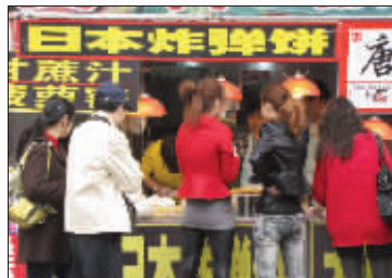
啥味道? 你要来一块日本炸弹饼吗?对不起,路过。(作者郑欣将获30元话费)