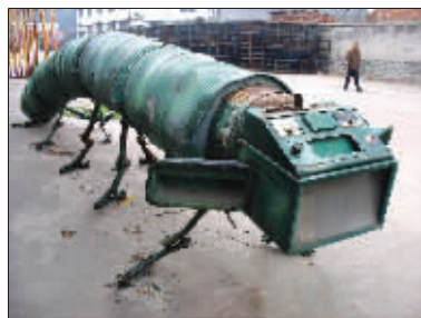
好大一条虫 幕府东路一家产业园区内,有一只用汽油桶等废旧金属做成的大虫。 (作者黄乐将获30元话费)