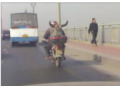
骑士,不再是传说 瞧这位哥们,肩背一只牛头骨,风尘仆仆过大桥,是不是有点骑士寂寞的味道…… (作者将获30元话费)