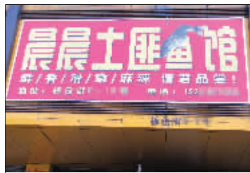
幸福生活 晨晨爱上了“土匪”,还开了家餐馆? (作者郑欣将获30元话费)