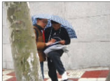
最用功的学生 放学路上,两个小学生讨论作业,瞧这认真劲,令人肃然起敬。 (作者朱玉祥将获30元话费)