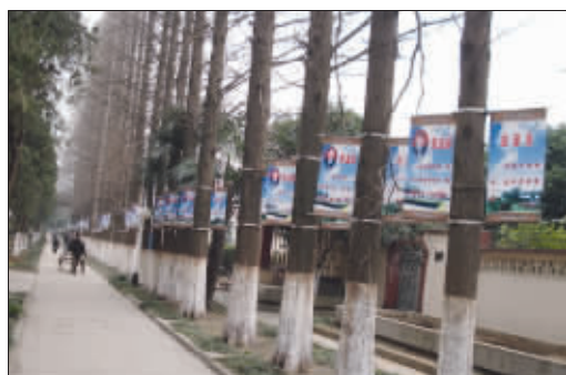
先进不能这么“树” 江都一景区内,20余面先进人物的大铁牌死死地箍在大树上。(作者胡剑明将获30元话费)