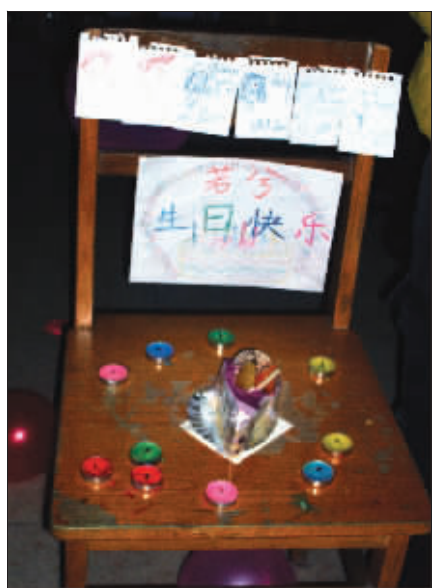
你快乐吗?我很快乐 这是一位大一女生的生日宴,有蛋糕,有烛光,有祝福,足矣! (作者余佳柳将获30元话费)