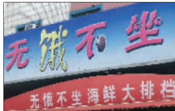
警告 不饿就不能坐!雷人。 (作者余跃军将获30元话费)