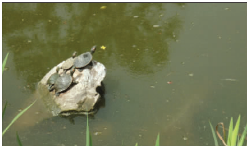
瞻园里,四只可爱的小龟列队趴在石头上,高昂着头,兴致勃勃地看灰机! (作者顾宁将获30元话费)