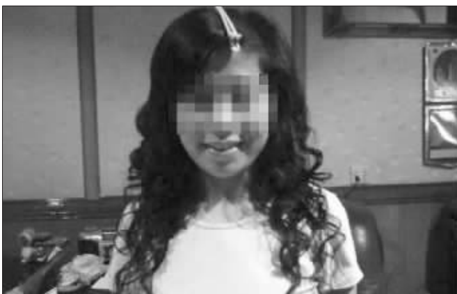
网上流传的女干部的照片