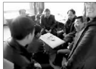
8名机关人员在上班时聚赌

昨日,兴和县县委县政府通报,参赌人员全部为该县林业局工作人员,其中还有一名副局长和森林公安分局副局长。昨日,该县召开紧急县委常委会议,决定免除4名参赌官员的职务。据《新京报》