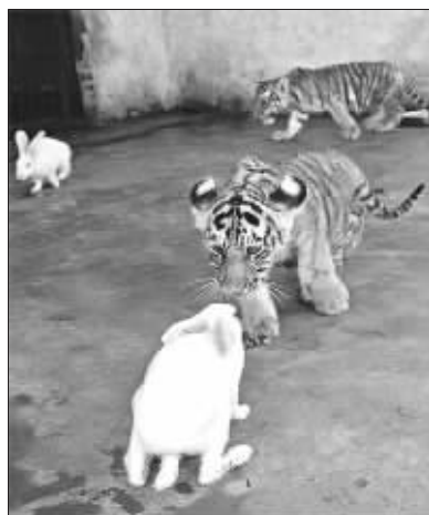
老虎和兔兔的和谐生活