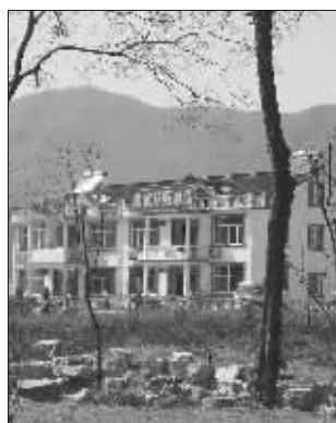
这样的饭店不下50个