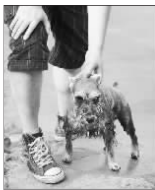
圈友“唤来换去”的落水狗