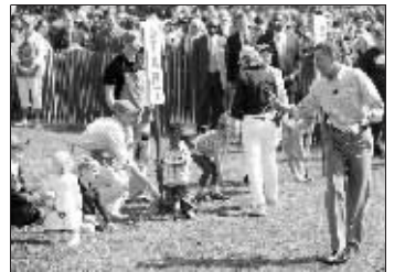
奥巴马在白宫南草坪参与复活节滚彩蛋活动。