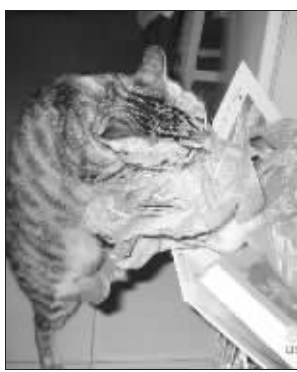
圈友“我爱都市网”家吃素的猫

都市圈网举办的“我与宠物的故事”, 在圈友不断接力下, 已经推出了11集。宠物先后登台, 成了“南京茶馆”里最具生活情趣的风景。 圈友我爱都市网在网上晒出的是一只“吃素”的小猫。所谓有图有真相, 这只猫咪显示出对青菜的偏爱, 引得楼下跟帖圈友冰镇小柠檬直呼“佩服”。 当然, 圈友冰镇小柠檬也并非只是围观, 她晒出了老家最常见的农家宠物小鸡小鸭。冰镇小柠檬感叹说: “估计很多朋友都