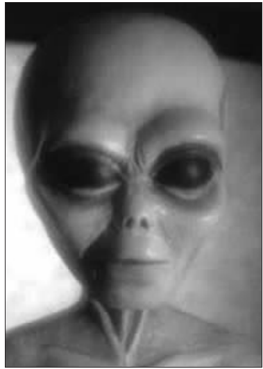
外星人发起袭击? (资料图片)

白宫举办复活节滚彩蛋活动传统始于1878年。之前, 滚彩蛋活动曾在国会山举行多年。 郝婕(新华社)