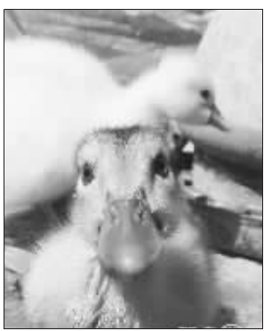
圈友“冰镇小柠檬”老家的宠物