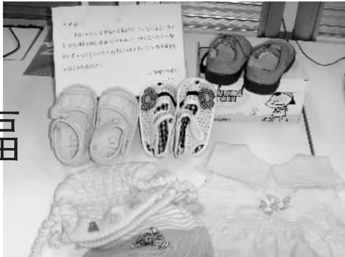
靖江的点点妈妈给暖暖写下温暖的慰问

4月2日的早晨还有一股寒意,1岁的杜元君和4岁的李天煜就在爸爸妈妈的带领下赶到南京市儿童福利院。点宝李天煜和爸爸不仅带来了小衣物,还有一个比暖暖还“高大”的泰迪熊,李爸爸说,由于李妈妈当日实在抽不开身,爸