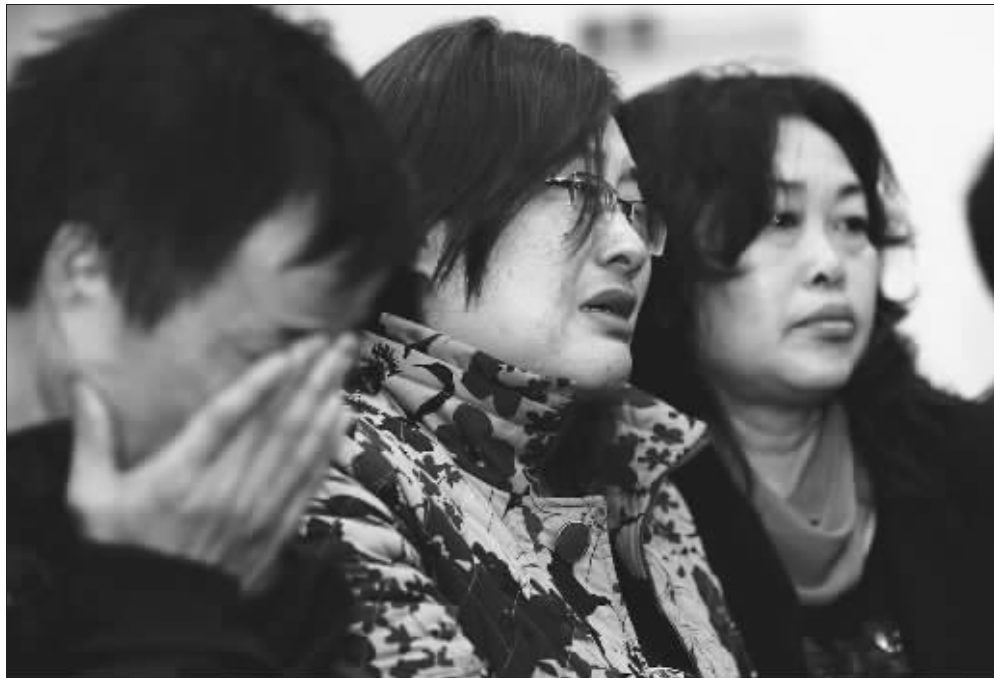
4月8日,遇害者家属在法庭上含泪旁听。