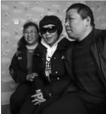
周洋一家三口在新装修的房子里

凭借两枚冬奥金牌,周洋获吉林省、长春市各160万元人民币的奖励,得了一套90平方米、位于长春市郊区的住房。长春师范学院也为周洋开出了诱人条件:不仅学费全免,还给了她5万元奖励,以及每年9千元的奖学金。