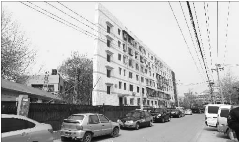
这样看,居民楼薄如卡片

正面看是一栋普通的6层居民楼,侧面看如同一张薄薄的“卡片”,却竟有百余户居民在此居住十多年。这是北京丰台区纪家庙一栋“奇特”的居民楼。居民称,房屋质量没问题,“卡片楼”是观者视觉角度差异造成。