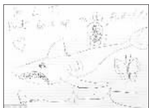
这幅画让人实在不敢恭维

英国埃塞克斯郡伊尔福特市出租司机乔恩·霍斯利一次开车搭载英国著名艺术家达米恩·赫斯特时,坐在后座上的赫斯特竟用铅笔随手画了一幅“涂鸦作品”送给霍斯利当“小费”。霍斯利做梦也没想到的是,英国拍卖行艺术专家对赫斯特的这幅“信手涂鸦画”进行评估后,都认为这幅画能在拍卖会上卖出5000英镑的高价!这堪称是霍斯利15年出租司机生涯中收到的最昂贵的一笔“小费”了!