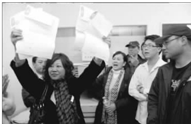
购房者高举当初的选房申请书

下午5点,售楼方负责人先后撤离现场,但大厅内仍有上千人在等待处理结果,众人表示,若晚间仍无答复,将睡在售楼大厅内。