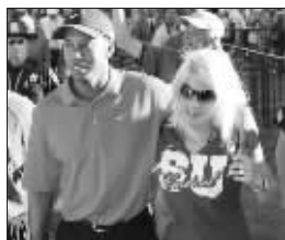
他们都曾有过甜蜜的时刻

据美国多家媒体报道,老虎伍兹与艾琳已正式分道扬镳,他们不久将签署离婚协议。“离婚是100%的,”ABC新闻网站援引一位消息灵通人士说,“在签署离婚协议之前,她想把所有见不得人的事情公布于众。”此外,伍兹已报名参加美国高尔夫球公开赛。 腾文