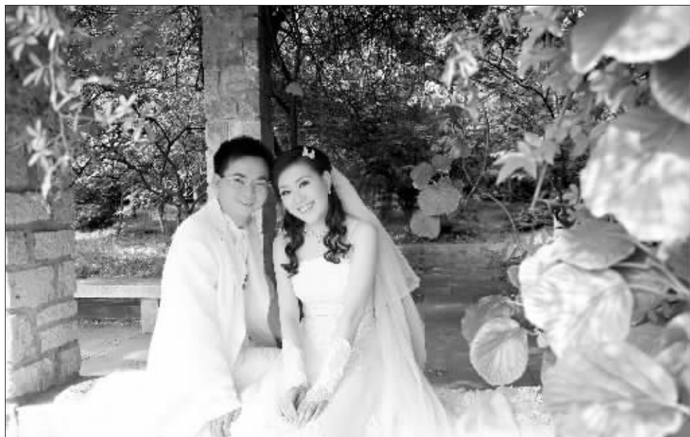
爆米花园园与老公的婚纱靓妆照

免费听讲座、互动有奖，还送电影票，这样的好事上哪找？上我能网！结婚班车首站“百变新娘—婚纱靓妆秀”邀请30对新人线下小聚，秀婚纱、做彩妆，参加互动还有精美奖品赠送。