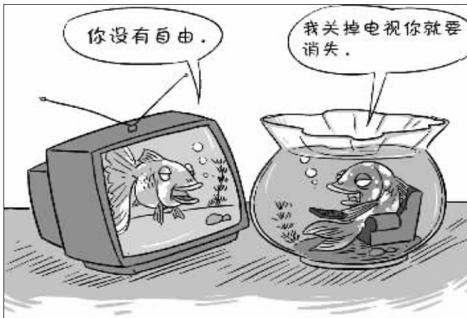
姚万 ■ 绘