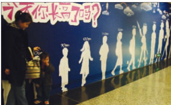
宝宝过来,妈妈给你量身高

购票大厅写着:患病儿童,只需持病历、挂号单等证明,即可领取爱心糖果一份。地铁站管理说,其实不用看病历,这里距儿童医院很近,很多孩子看完病,拿着气球来坐地铁,规定不能带气球进站,孩子就哭闹,工作人员就会