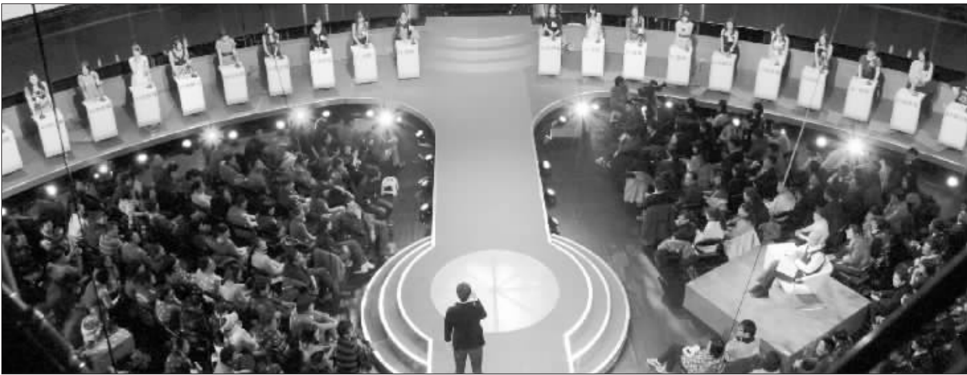
《非诚勿扰》不经意间正在开创中国本土真人秀的春天