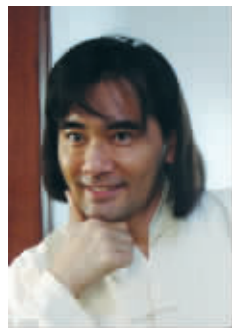
找化妆师自制刘海

相多次。网友们称他为“赵蜀黍”,他就自己把自己叫“蜀黍”,配合着网友们一起打闹。自发贡献出自己的新近照片,称“你觉得好笑?真巧,蜀黍也破涕为笑了。”本尊出炉,此帖更是火上加油,不少网友都是赶来和赵文口“合影”的,“合影”方式如下:复制赵蜀黍回复内容,加上“合影”二字,发表。除了天涯的ID,赵文口在自己的百度贴吧也有ID“文王宣”,发帖、回帖甚是勤快。