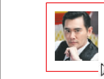
最资深明星网友:赵文

现在这个时代里,不上网的人已经很少了吧?既然明星也是人,所以他们当然也会上网——可是他们都在哪里呢?他们是不是潜伏在我们周围呢?如何找出他们上网的蛛丝马迹呢?像网友一样在网上混迹的明星,会让网友们感觉亲切不已。配合恶搞的明星们甚至能有意外加分。不过想披个马甲就往自己脸上贴金的明星,请千万当心,网络水深,精分谨慎。