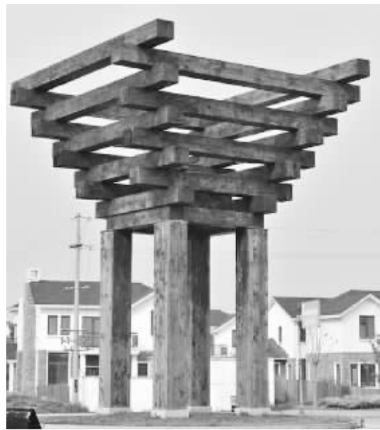
同里镇标 资料图片

上,同里镇标只能算“小弟弟”,但是论年纪,它的设计建造又确实比中国馆要早。那么这两个相似程度颇高的建筑之间究竟有没有什么关联呢?很多围观网友前往鉴定之后表示:它们可能是源于中国古代建筑文化。